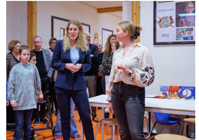
Het project de Eerste Inclusieve Generatie wordt 2 december 2024 officieel geopend door staatssecretaris Vicky Maeijer van Langdurige en Maatschappelijke Zorg.

Kinderen met en zonder handicap die vanzelfsprekend samen opgroeien: dat ideaal brengen we komende drie jaar in de praktijk in de gemeente Deventer. Met de gemeente, het Ministerie van VWS en lokale organisaties gaan we hier de allereerste inclusieve generatie mogelijk maken. Met scholen, sportclubs, speeltuinen, ouders, kinderen en andere betrokkenen gaan we ondervinden wat er nodig is om van jongs af aan samen te spelen, te sporten, te leren en aan cultuur te doen: samen te leven. Na drie jaar zullen we onze lessen uit de proeftuin Deventer ook toepassen in andere gemeenten.