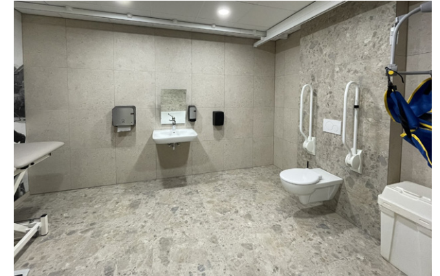
Oorlogsmuseum Overloon opent een nieuwe educatieve vleugel, met daarin een volledig toegankelijk Changing Places Toilet.

Veel kinderen met een ernstige beperking moeten liggend verschoond worden, ook als ze groter worden. Sanitaire voorzieningen zijn daar niet op ingericht. Een dagje uit met het gezin is dan vaak onhaalbaar. Daarom steunen wij culturele toplocaties om Changing Places Toiletten aan te leggen. Dit zijn fijne en veilige toiletruimtes waar liggende verschoening mogelijk is. In 2025 maken we 6 nieuwe Changing Places Toiletten mogelijk, onder meer in de Efteling en Oorlogsmuseum Overloon. Zo maken we het verschil voor vele gezinnen die hierdoor wél samen een dagje uit kunnen.